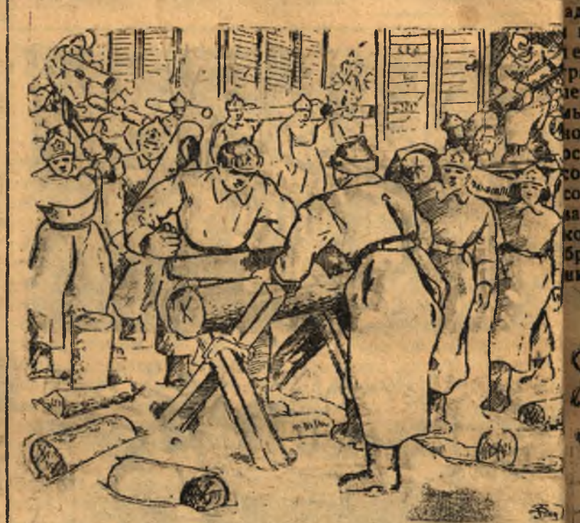
Бойцы подшефного артполка на субботнике у шефов ВРЗ за разделкой и выгрузкой дров.

оказались группы полковой школы под руководством тов. Прибытнова, нарезали на 5 человек 24 кубометра, группа Сорочкина 21 км. на 5 чел., группа т. Стогина 18 км. на 5 чел. От 200