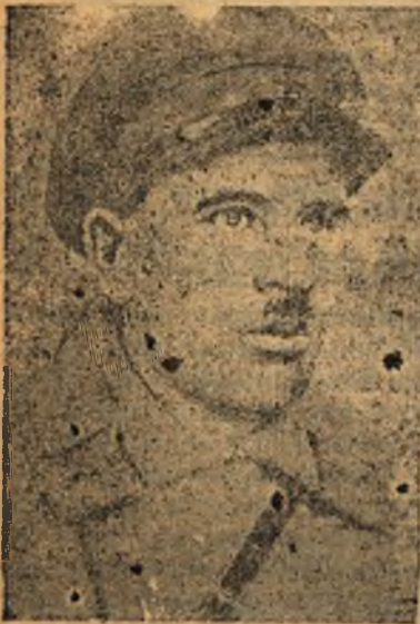
КОМИЧЪ В А. И.

Начальник пулеметного взвода, распорядившись о выводе пулемета, на ходу скинул шинель и без шапки выскочил на открытое крылечко. В сырой мути на-